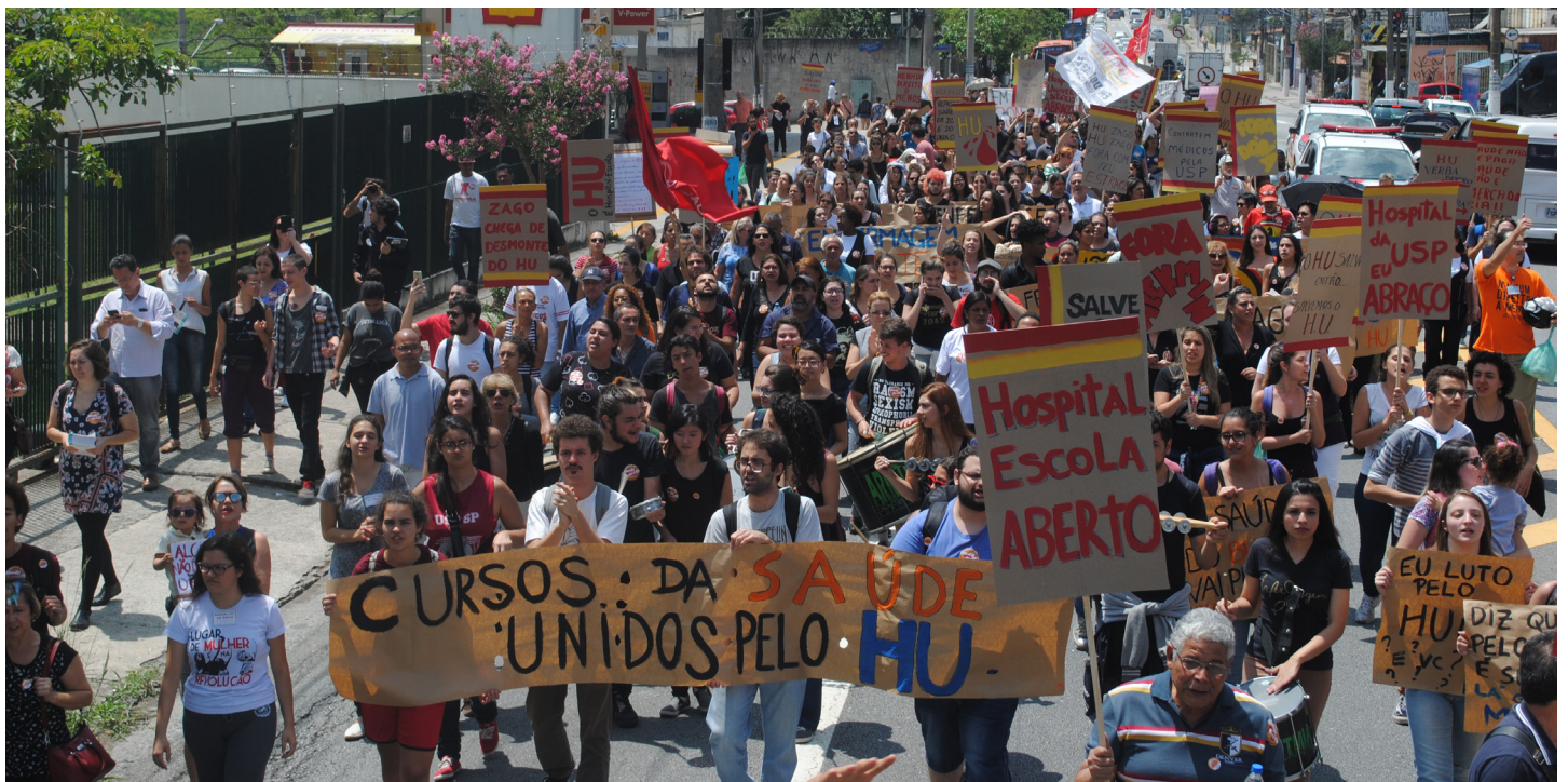
Passeata para o Abraço ao HU - nov/2017